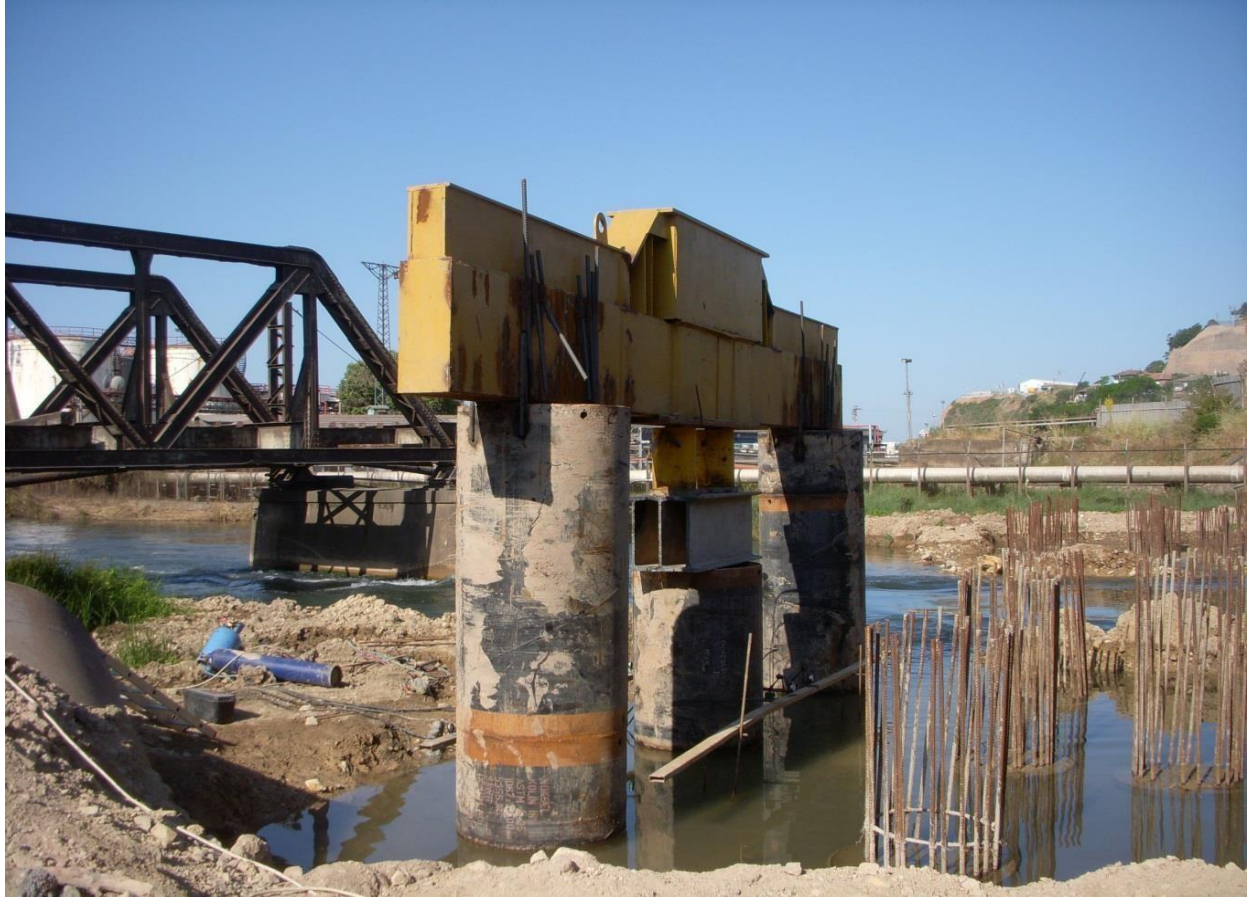
Kolin İnşaat Köseköy – Gebze Yol inşaatı