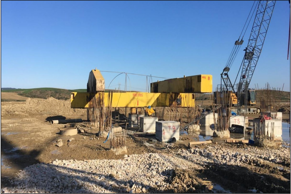
Adana-Ceyhan EMBA Hınlılu Termik Santral Projesi Eksenel Kazık Yükleme Deneyi (9 adet)