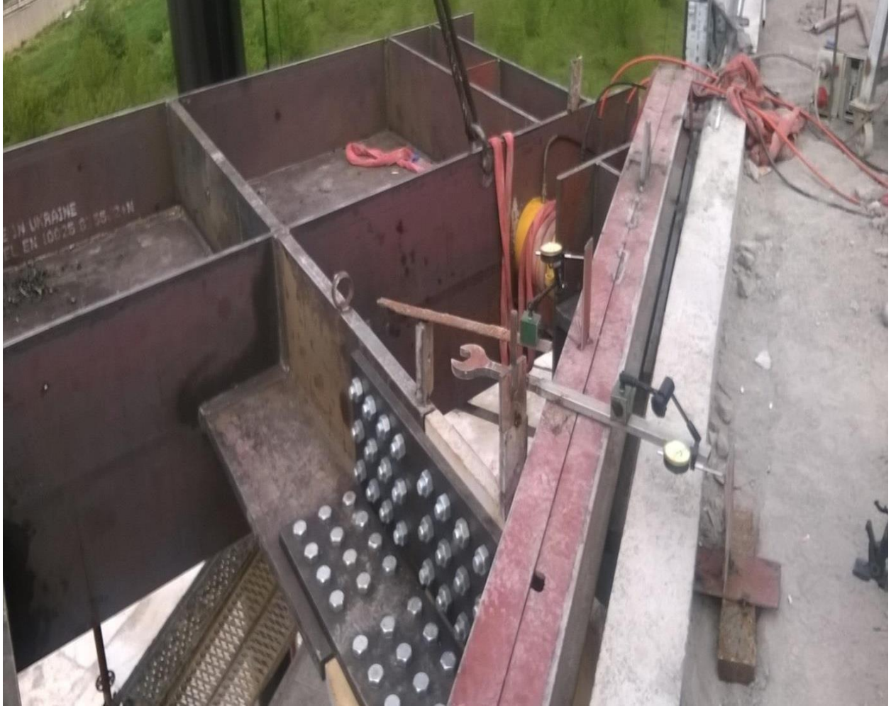
Gintaş İnşaat Bursa Büyükşehir Stadyumu Projesi Yatay Yükleme Deneyi (2100 ton)