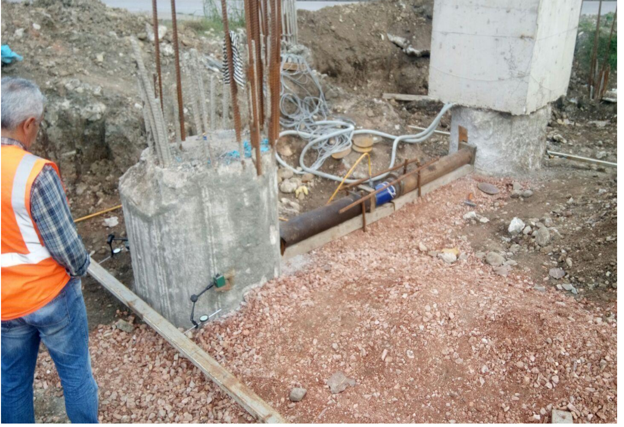
K.B.B. Outlet Center Kavşaađı Projesi Yatay Yükleme Deneyi