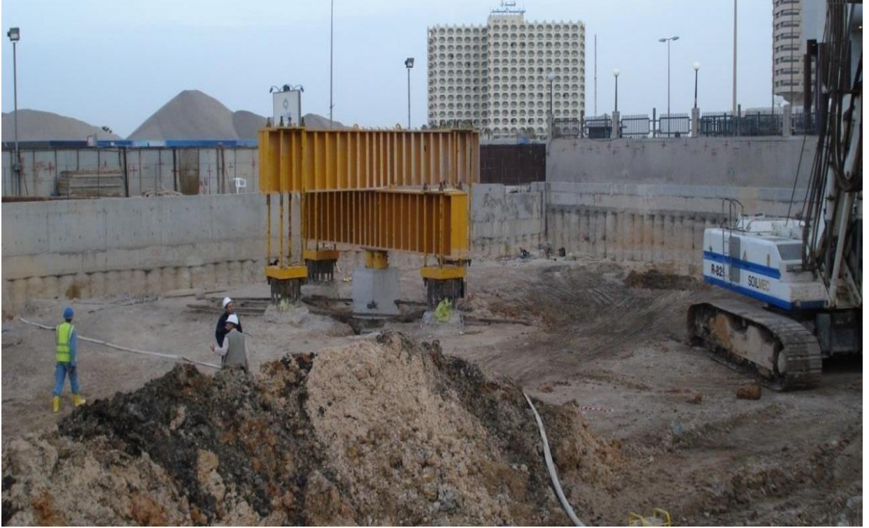
Summa_AL-TADAMON TWIN TOWER PROJECT