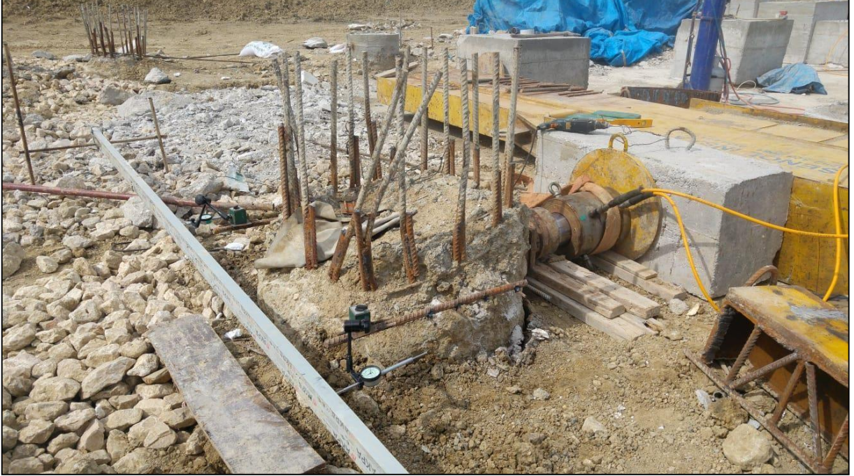
Adana-Ceyhan EMBA Hınlı Termik Santral Projesi Yatay Ykleme Deneyi (19 adet)