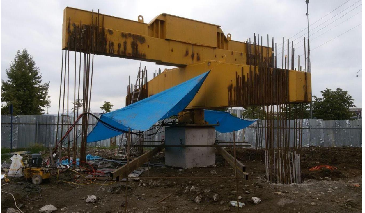
K.B.B. Outlet Center Kavşaađı Projesi Eksenel Kazık Yükleme Deneyi