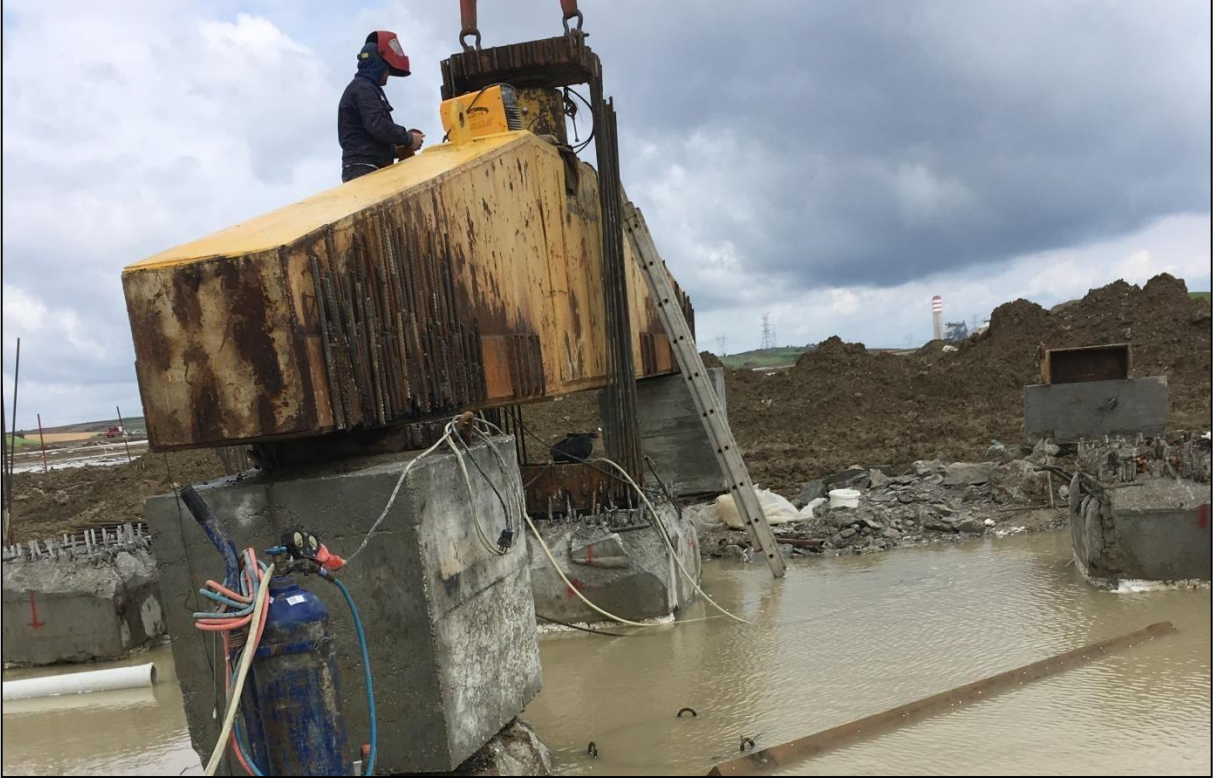
Adana-Ceyhan EMBA Hınlı Termik Santral Projesi ekme Deneyi (9 adet)