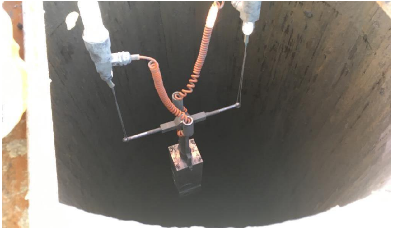
Adana-Ceyhan EMBA Hınlı Termik Santral Projesi Caliper Logging Deneyi (9 adet)