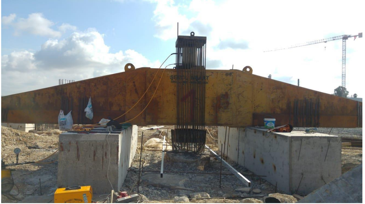
Adana SASA Polyester Sanayi A.Ş. SD Poy Polyester Tesisleri (Eksenel Kazık Yükleme Deneyi, Çekme Deneyi)