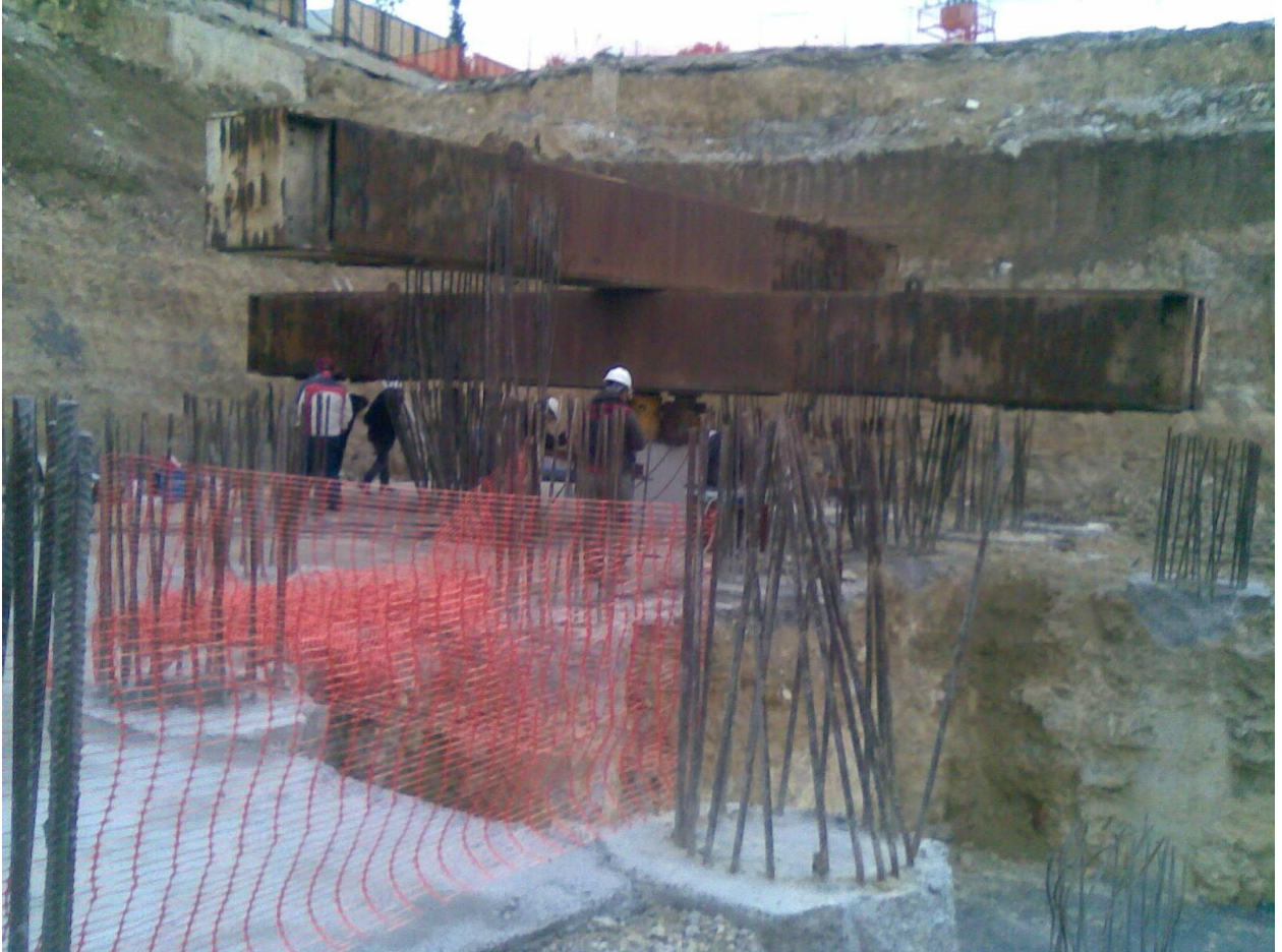
Teknik Yapı Halkalı Metrokent Projesi Eksenel Kazık Yükleme Deneyi