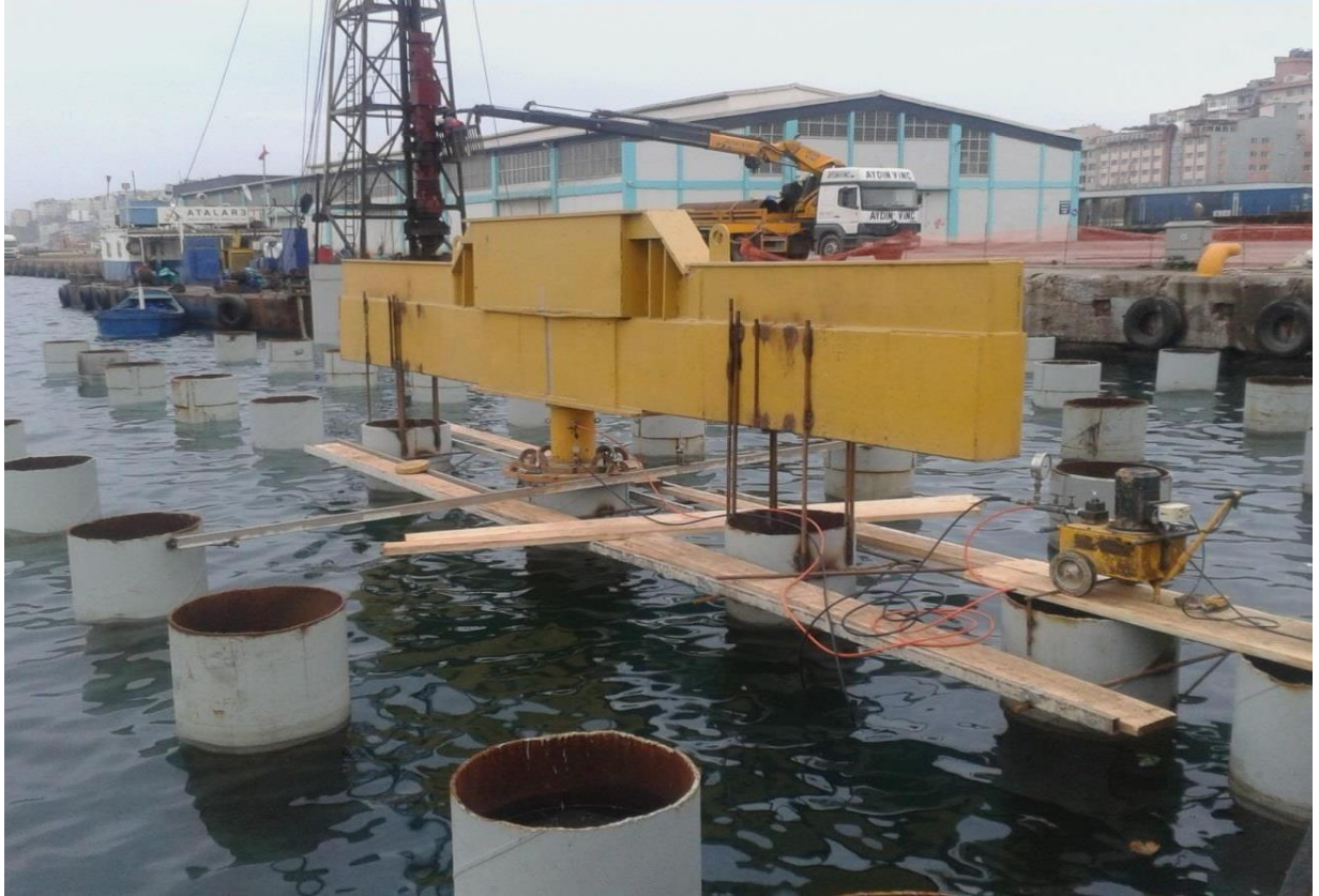
Bandırma Limanı 2 ve 3 Nolu Rıhtıma Feri Kapak Atma Rampası Projesi