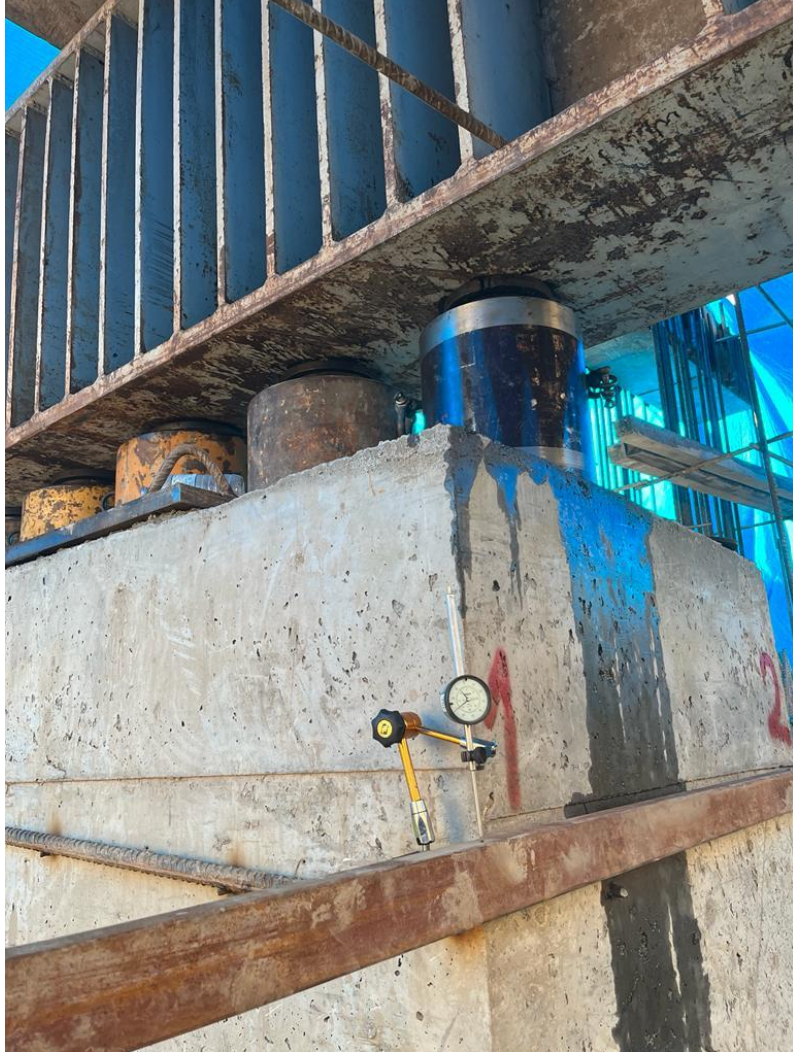
Rönesans Holding- İzmir Konak Karma Projesi Eksenel Yükleme Deneyi- 3000 ton- 3 adet (2023)