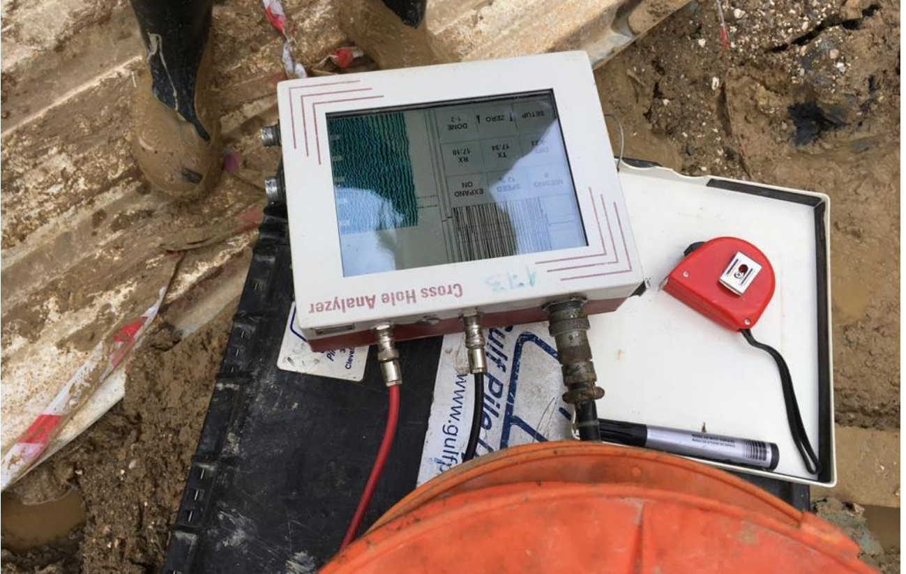
İzmir Folkart Vega Projesi / Barankaya Cross Hole Deneyi 4 Adet