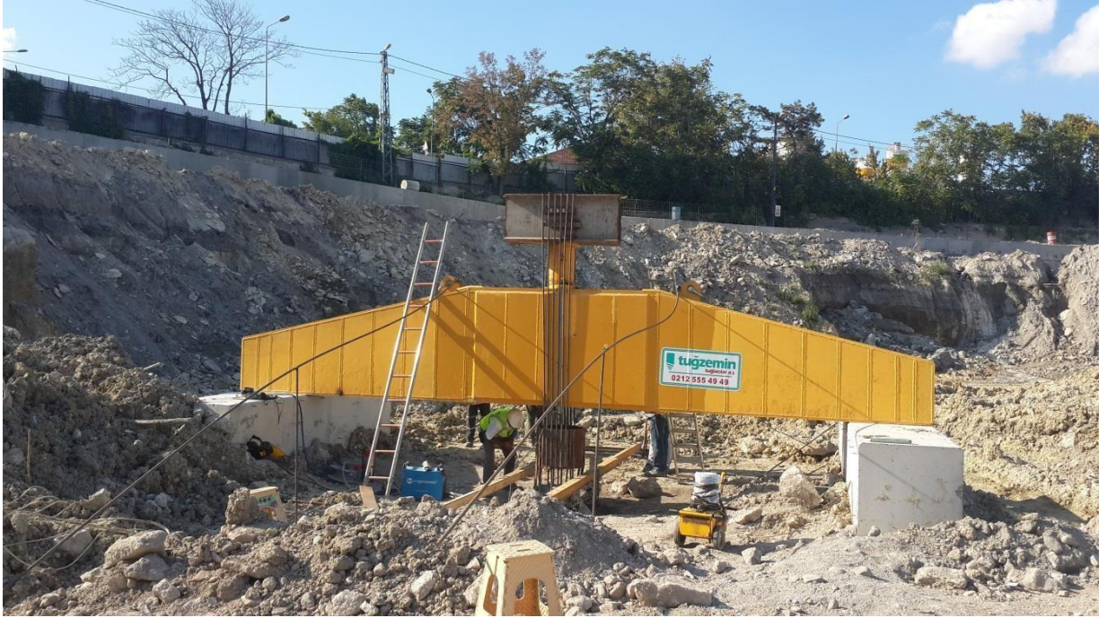
İstanbul-Bakırköy- Pruva 34 Projesi Çekme Deneyi