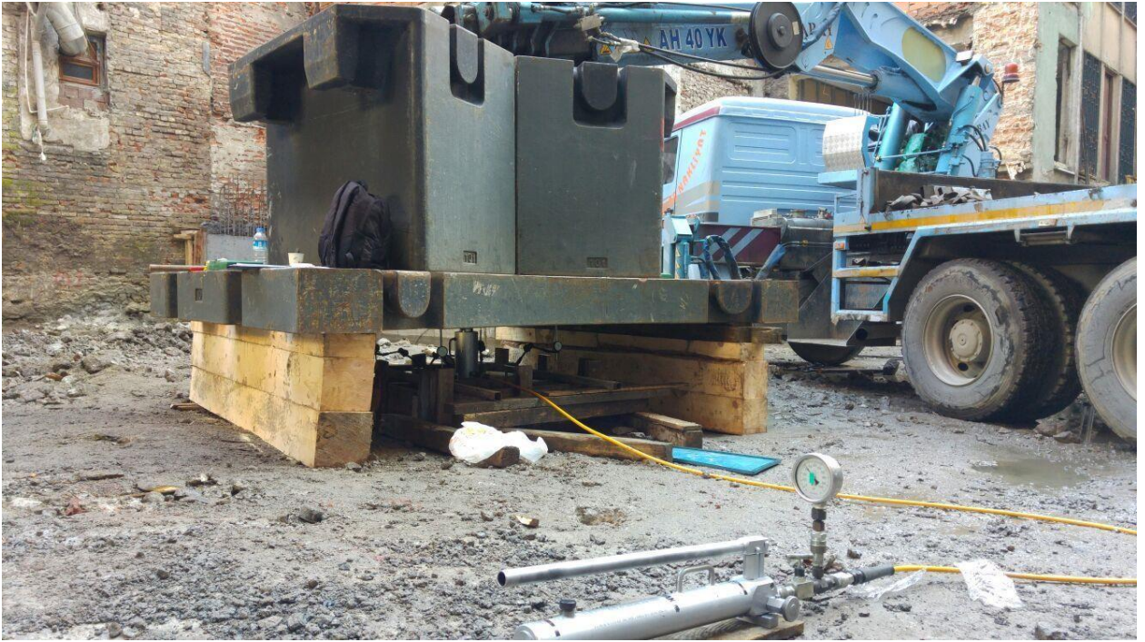
İstanbul Ticaret Odası 969 Ada – 78 Parsel Taşhan Binası ve Konksirksiyon İnşaatı, Plaka Yükleme Deneyi (3 Adet; 30 ton)