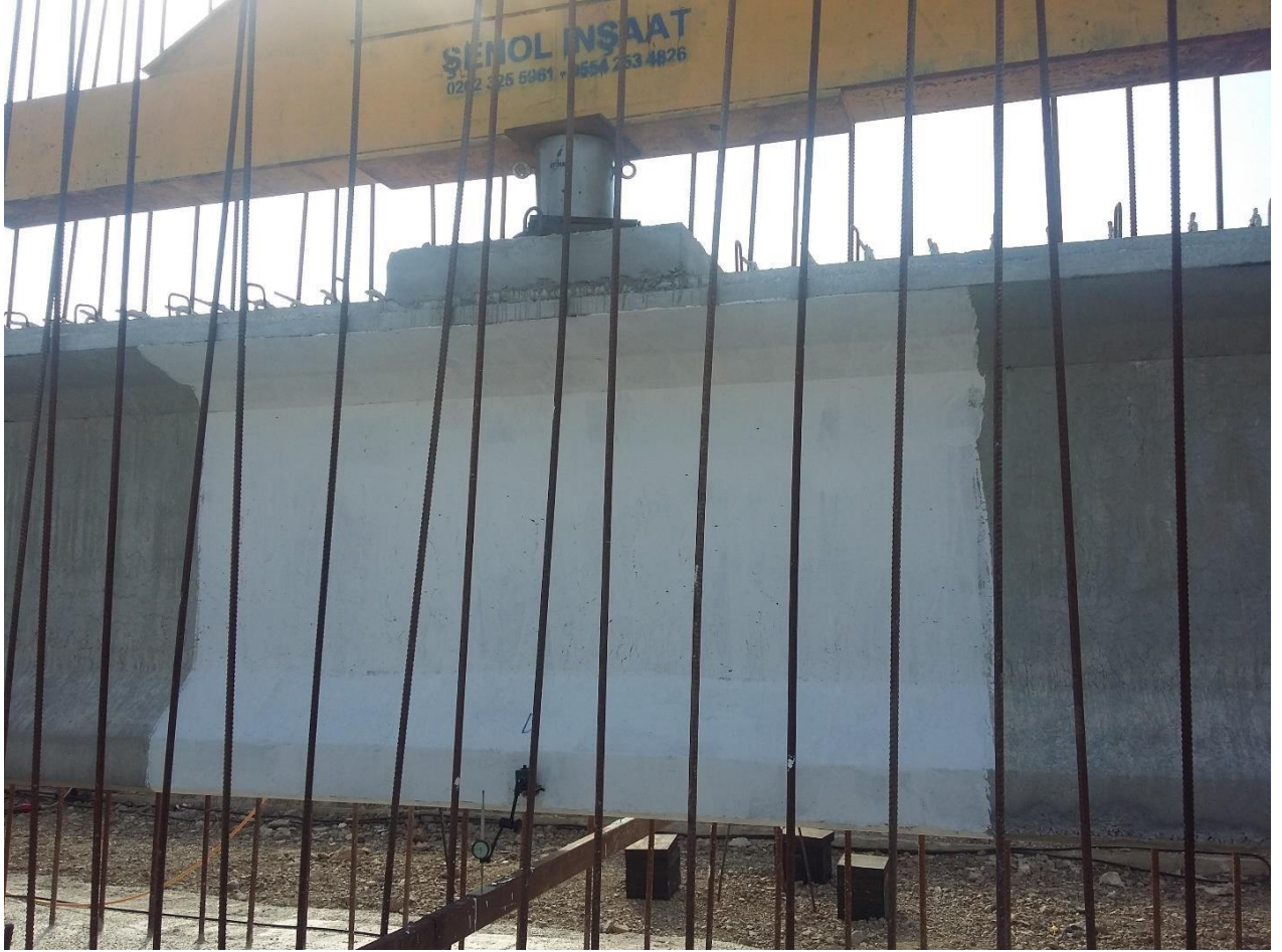
İstanbul – İznir Otoyolu Projesi Öngermeli Prefabrik Kiriş Yükleme Deneyi (11 Adet)