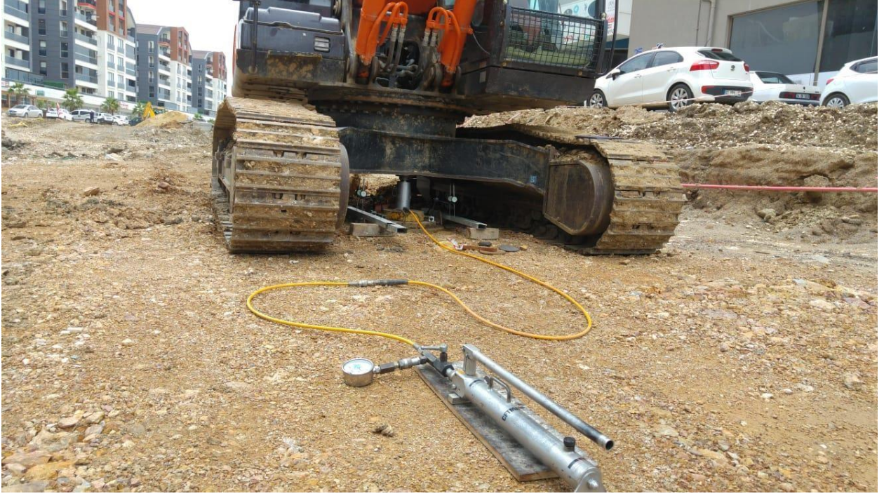
Demyol İnş. ve Taah. Mad. Nak. Pet. Enerji Turizm San. Tic. A.Ş. Bursa Pınar Köprülü Kavşağı Taş Kolon Plaka Yükleme (24 Adet)