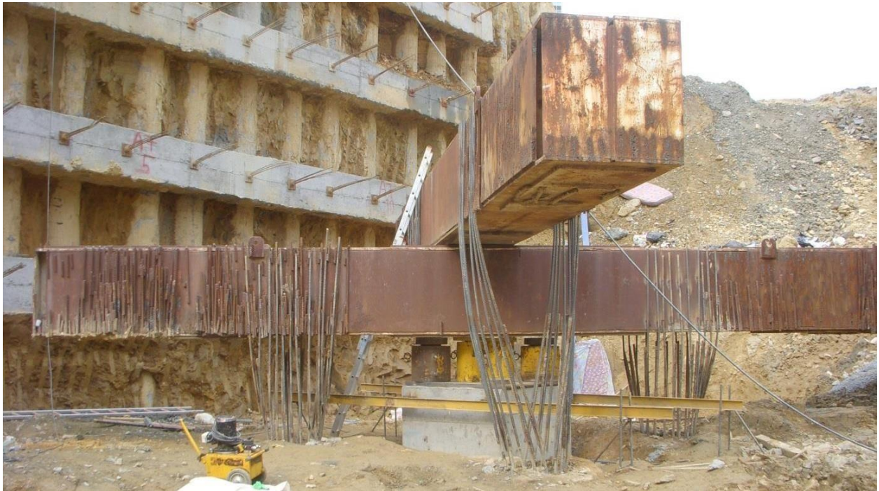
Kar Gayrimenkul Maslak Ofis Binası Projesi