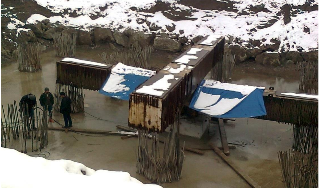
Erođlu İnřaat Bursa Harmoni Tower