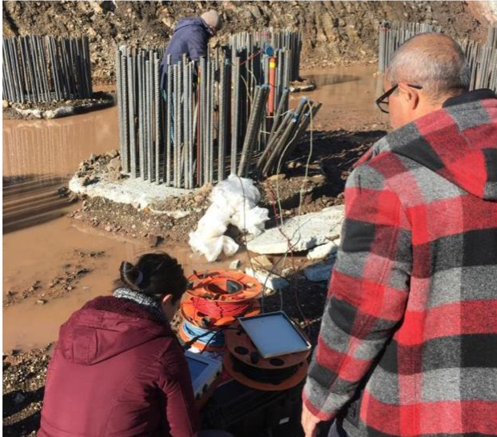
Ormanköy – Akyazı – Dokurcun – 4BL. HD. Yolu Projesi / Makyol Cross Hole Deneyi 5 Adet