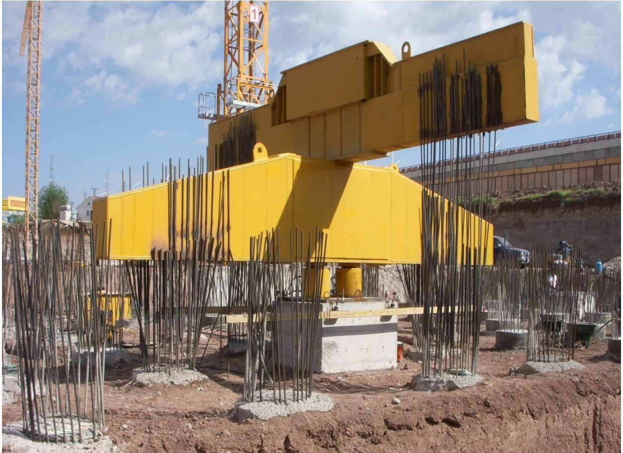
Çeysa Yapı Diyarbakır Seyranteppe İıkiz Kule İş Merkezleri Projesi Eksenel Kazık Yükleme Deneyi