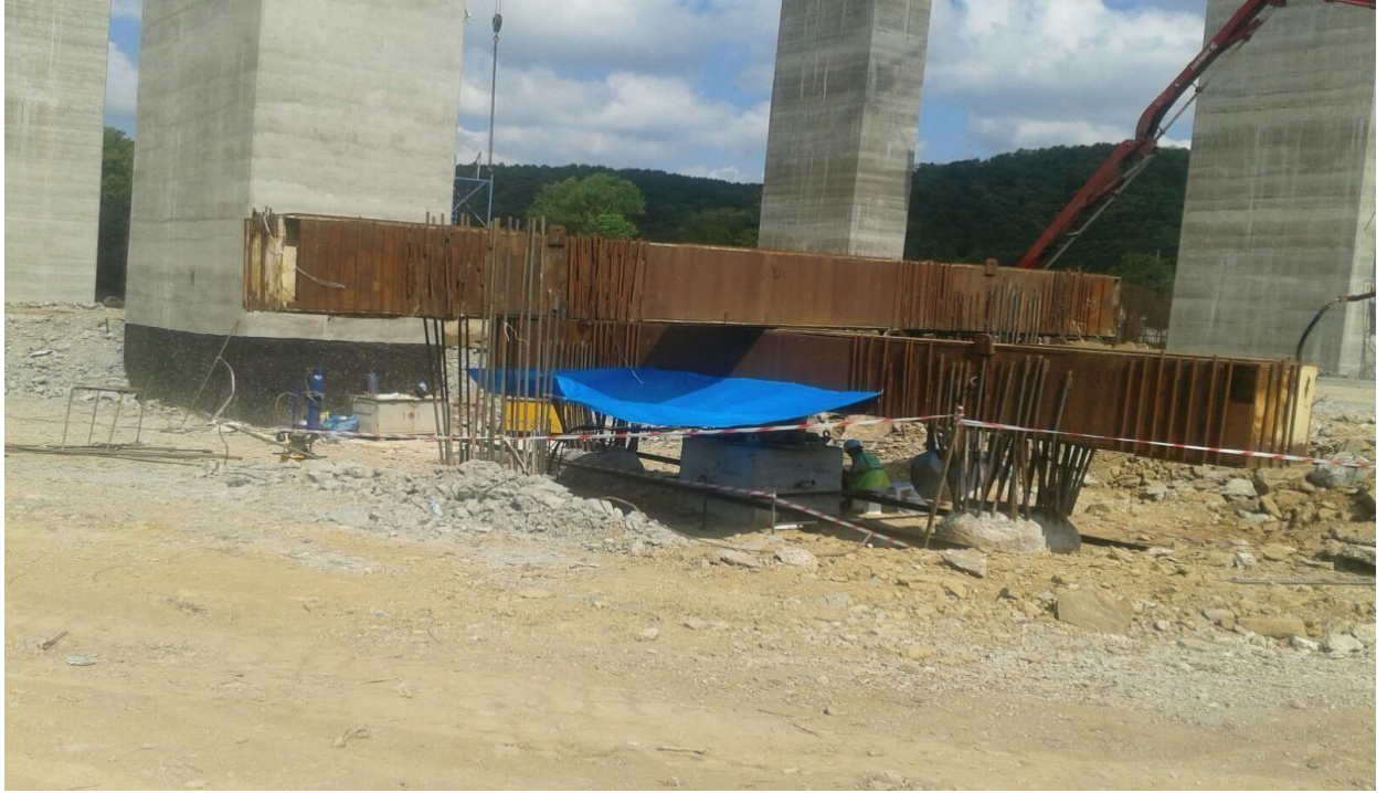
Kuzey Marmara (3. Boğaz Köprüsü Dahil) Otoyolu Projesi V26 Viyadüğü G6 Temeli Eksenel Kazık Yükleme Deneyi