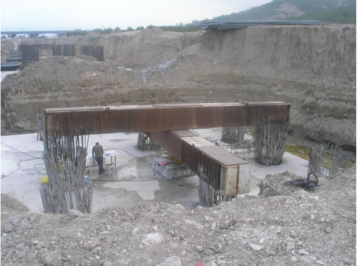
Pamukova Hızlı Tren Viyadük Temeli Eksenel Kazık Yükleme Deneyi