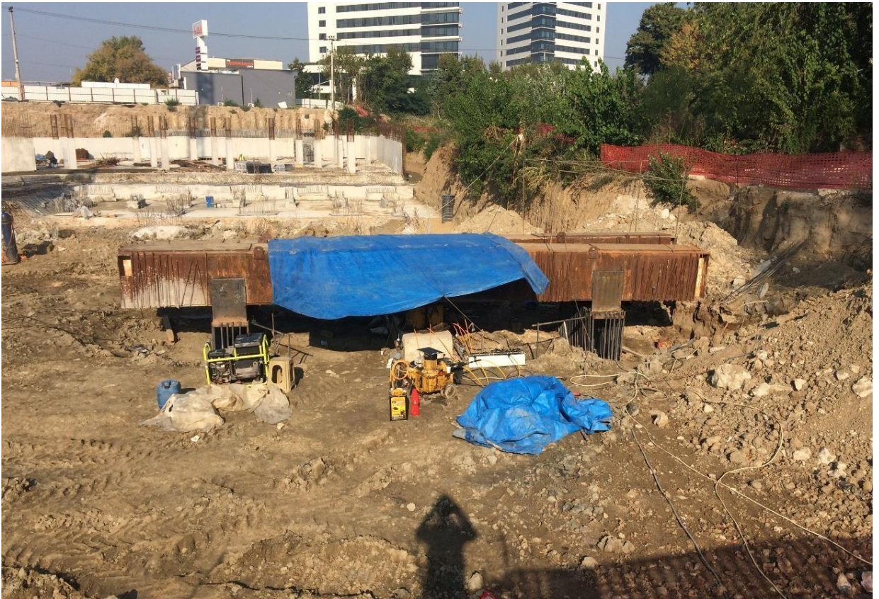
Bursa Sky Tower Projesi (Baret Kazık Yükleme Deneyi) 2700 ton