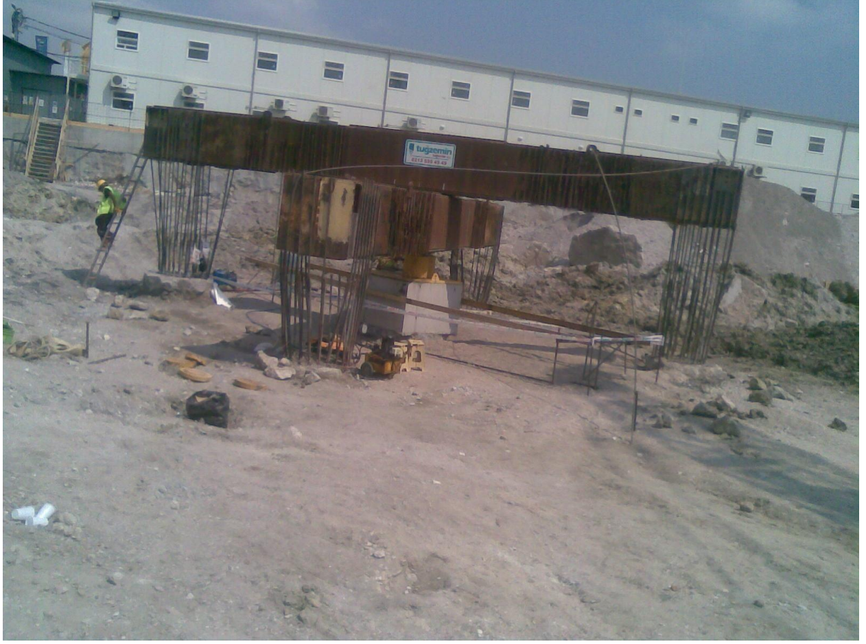
İstanbul-Bakırköy- Pruva 34 Projesi Eksenel Kazık Yükleme Deneyi