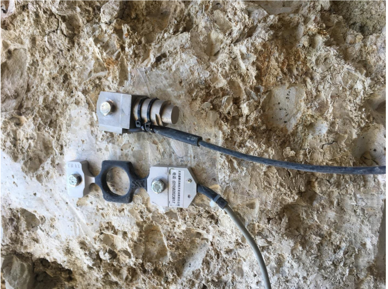
Adana-Ceyhan EMBA Hınlı Termik Santral Projesi Dinamik Yükleme Deneyi (PDA) (9 adet)