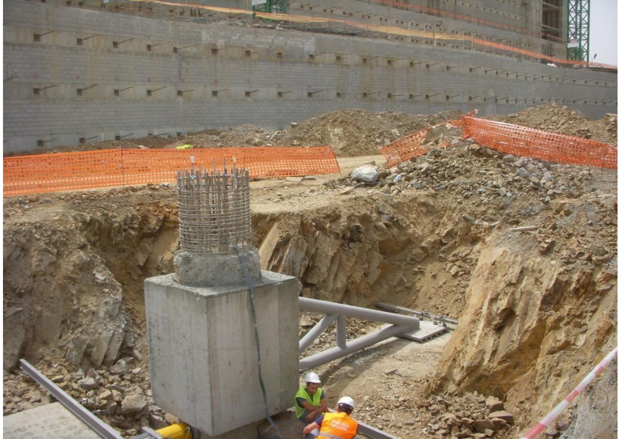
Ağaoğlu Maslak 1453 Yatay Yükleme Deneyi