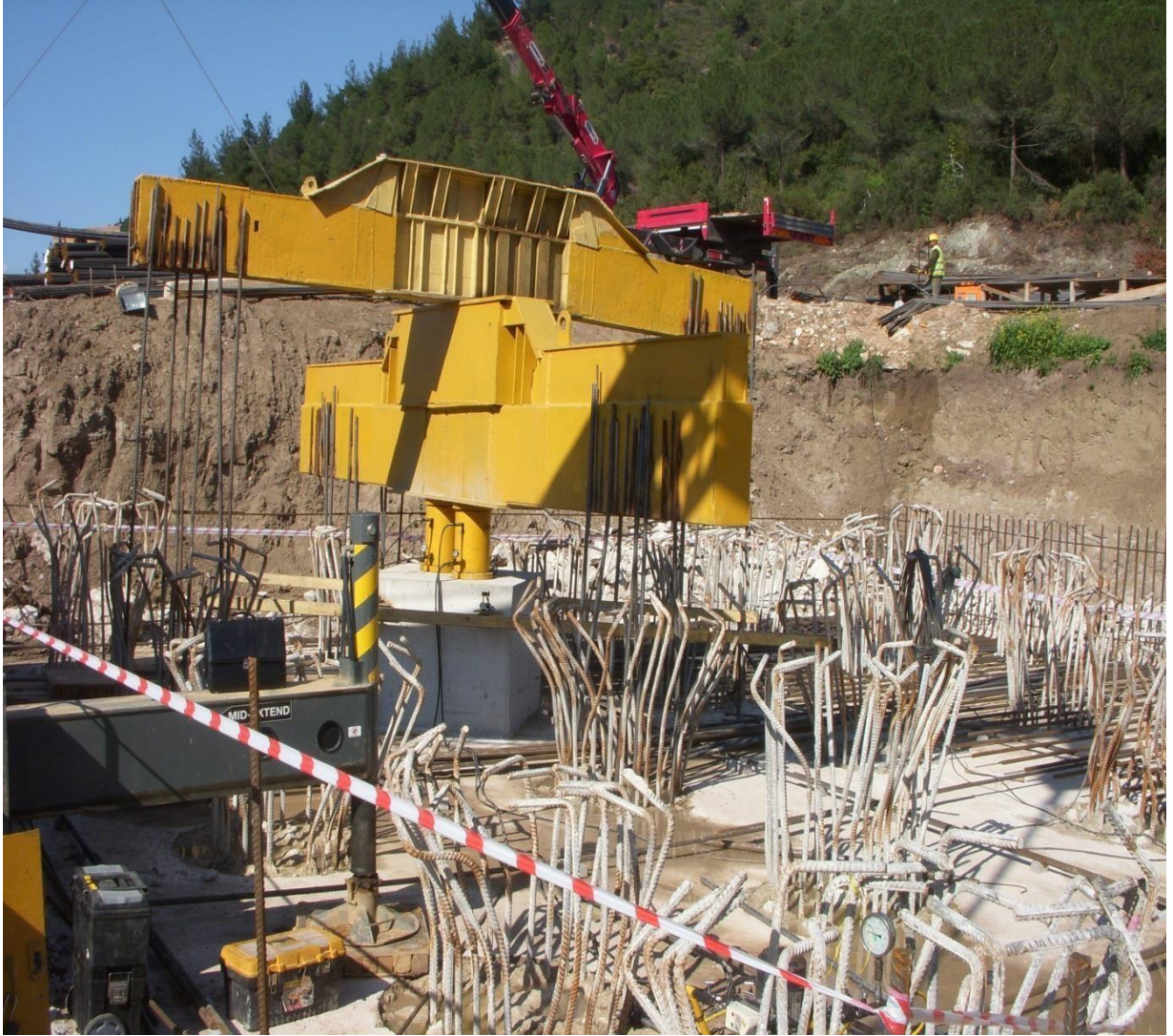
Makyol İnşaat Gebze-Orhangazi-İzmir Otoyolu Yap-İşlet-Devret Projesi Kurtul Viyadüğü Eksenel Kazık Yükleme Deneyi